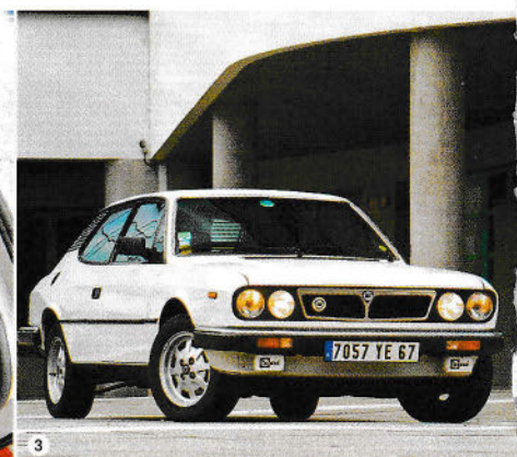
❶ Tout est correctement à sa place. Rien ne manque ? Si, un peu de soleil d'Italie... ❷ Polyvalente, la HPE est aussi à l'aise devant un grand hôtel que sur un parking de supermarché : bagages ou courses, elle accepte tout ! ❸ Voilà un break qui inspire le sport...

qui possède de nombreux emboutis communs avec le coupé, même si elle est un peu plus haute et repose sur l'empattement plus long de la berline. Initialement disponible en 1600 et 1800, puis 2000 carburateur, 2000 à injection et, enfin, 2000 à compresseur volumétrique Volumex, la HPE, rebaptisée HPEXecutive en 1981 lors de la présentation