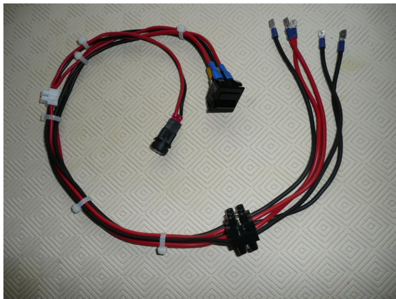
Figure 3 : câble de secours

ATTENTION : Ne vous lancez pas dans une telle opération si vous n'avez aucune compétence en électricité automobile. Vérifiez plusieurs fois votre câblage car le neiman n'est pas protégé par fusible. Risque de court-circuit et d'incendie en cas d'erreur.