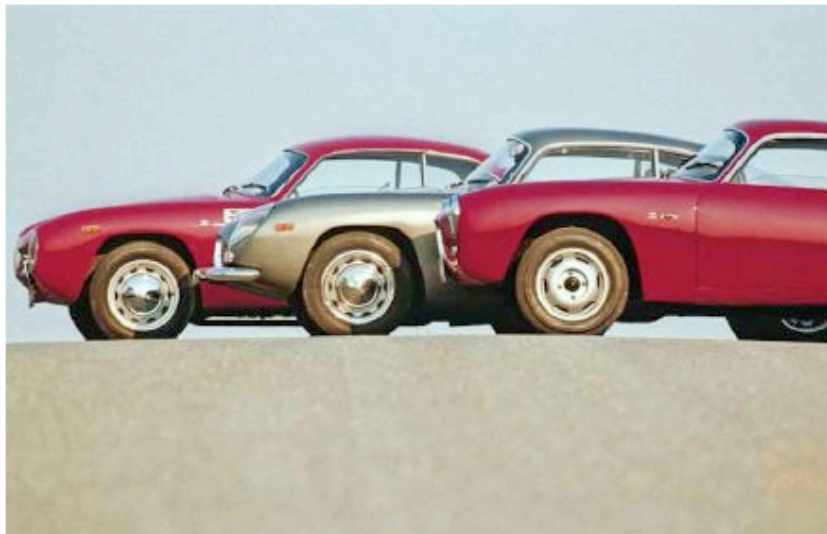
Appia Sport ( 1961-1962)