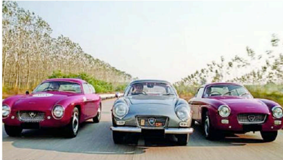
Appia GTZ ( 1957 )

Puis ce sera la version GTE, et finalement à la version SPORT (chassis court et allégé) :