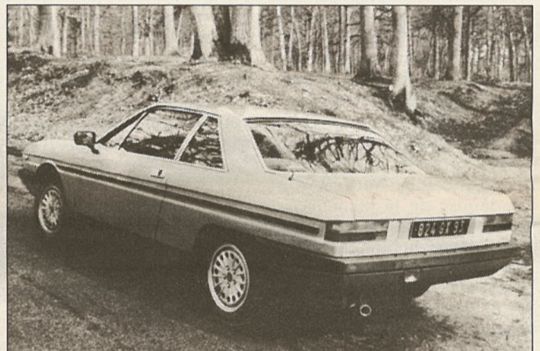
Vu de l'arrière, le coupé Gamma est moins séduisant. A cause du grand coffre ?

L'habitacle également a été conçu par Pininfarina, qui a logé quatre vraies places. Mais il ré-