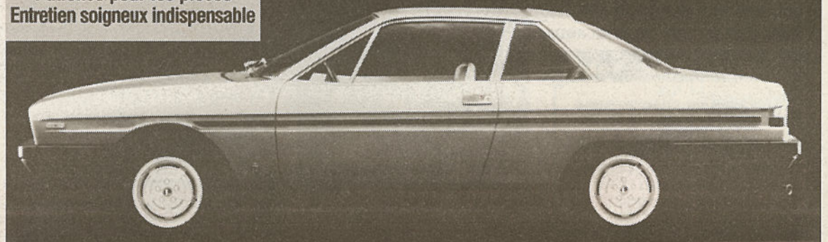
Pininfarina a dessiné une forme très pure, avec juste un léger décrochement au niveau des portes

Finition légère Corrosion Patience pour les pièces Entretien soigneux indispensable