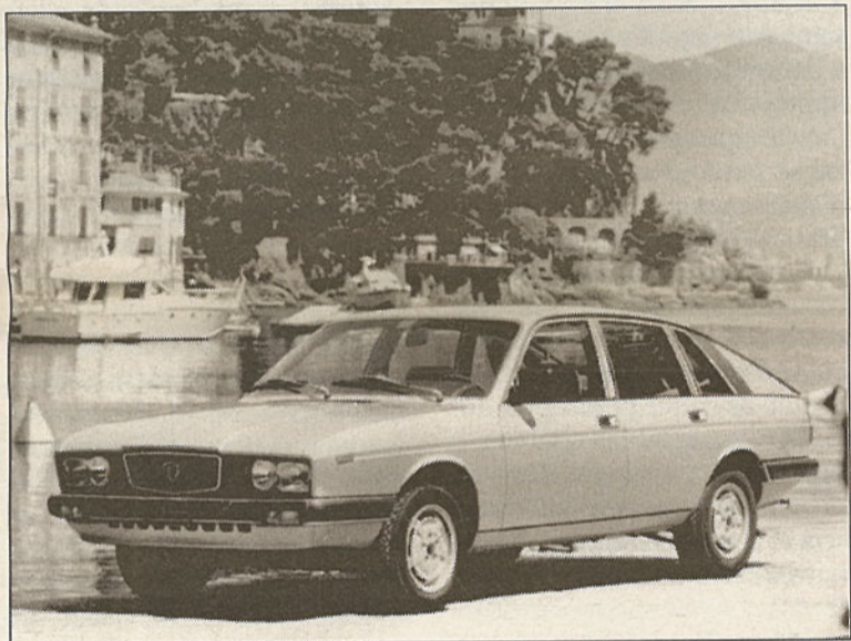
La berline était une deux volumes, au dessin pas très heureux.

nique. Soyez particulièrement attentif aux bruits de distribution.