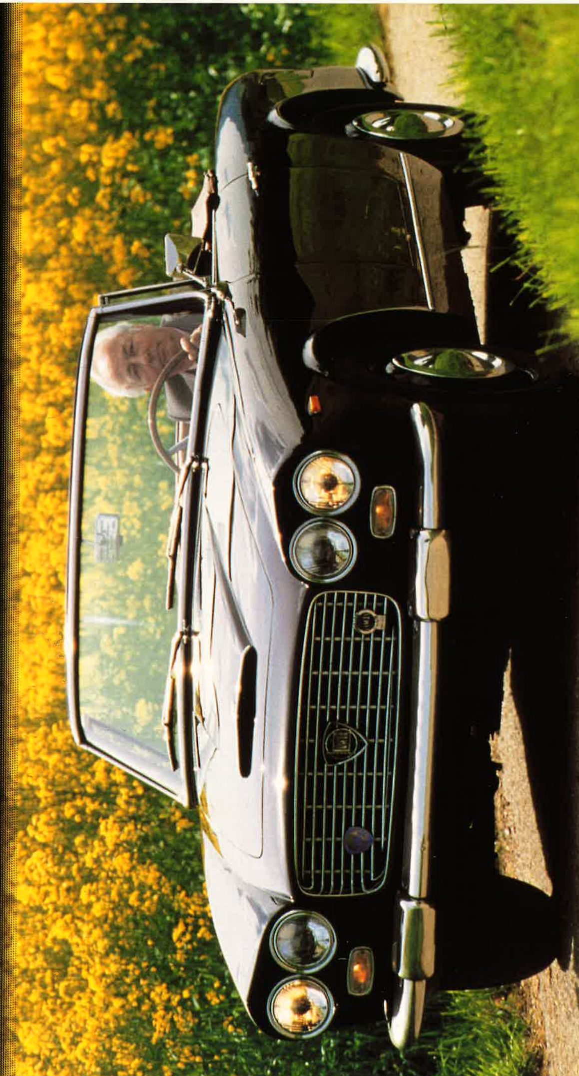
LANCIA FLAMINIA GT 3C