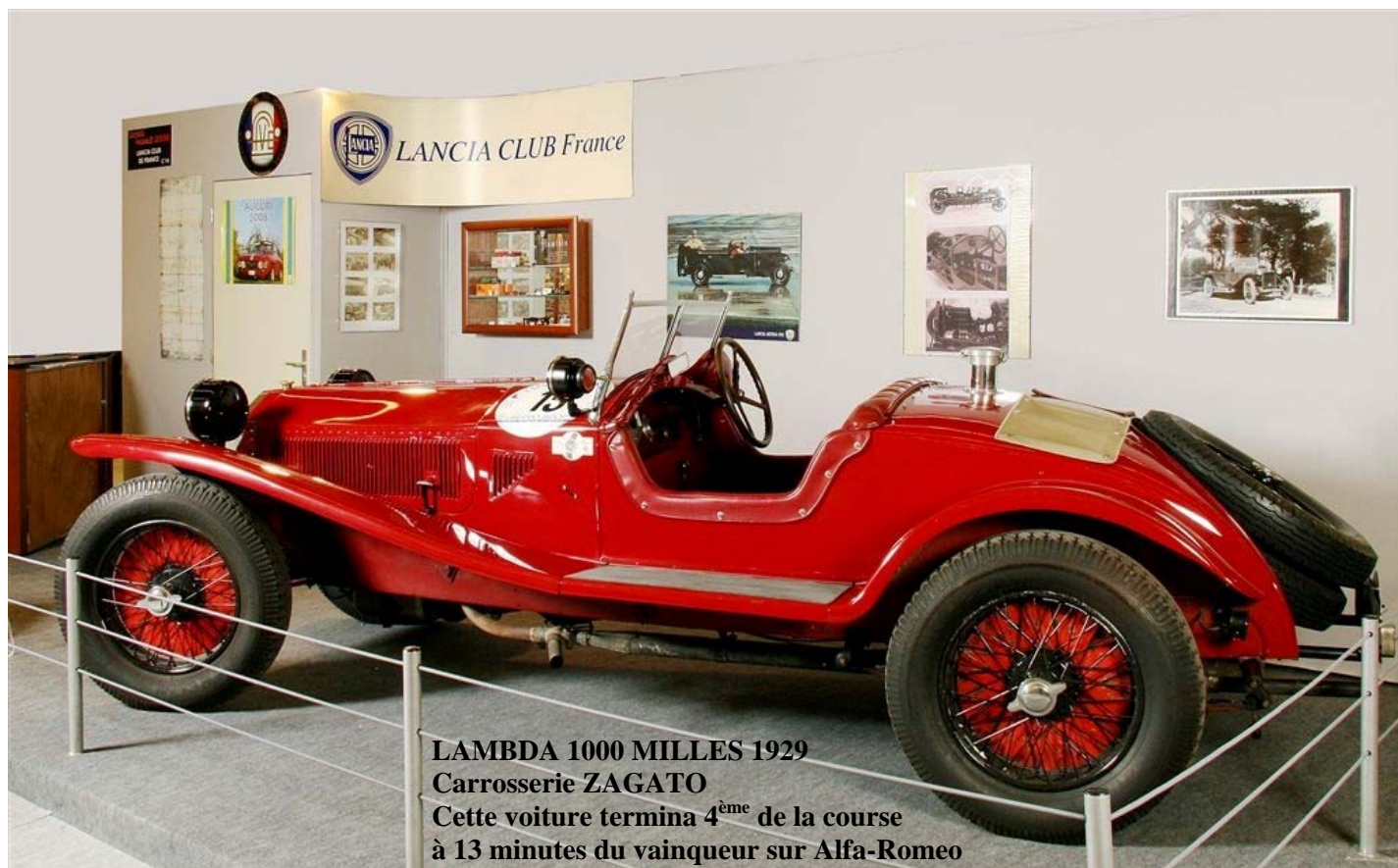
LAMBDA 1000 MILLES 1929 Carrosserie ZAGATO Cette voiture termina 4 ème de la course à 13 minutes du vainqueur sur Alfa-Romeo