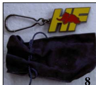
Porte-clé HF origine Lancia Livré dans une bourse bleue