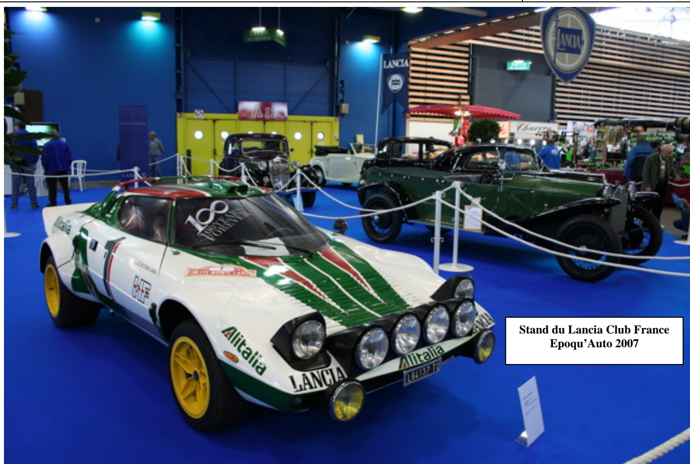
Stand du Lancia Club France Epoqu'Auto 2007

11-13 mai : 4 ème DeltaDays 2007 dans les Alpes J.P. VOISIN web.mac.com/j.p.voisin/iWeb/DD07/presentation.html