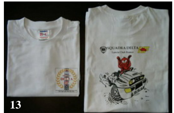
T-shirt Squadra Delta HF – logo sur poitrine et elefantino dans Delta Cabrio au dos