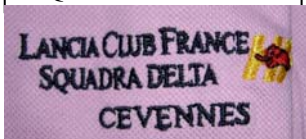
Polo HF taille L ou XL Quantité très limitée