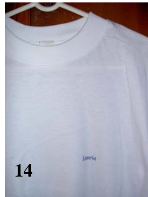
Tshirt Origine Lancia taille XL Coton blanc Inscription Lancia discrète