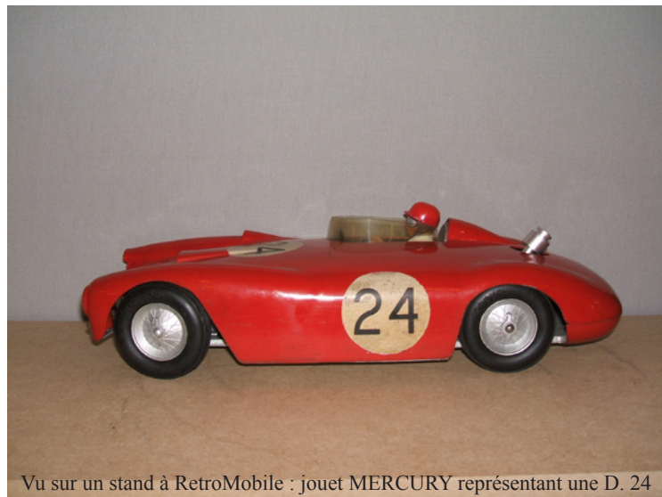
Vu sur un stand à RetroMobile : jouet MERCURY représentant une D. 24