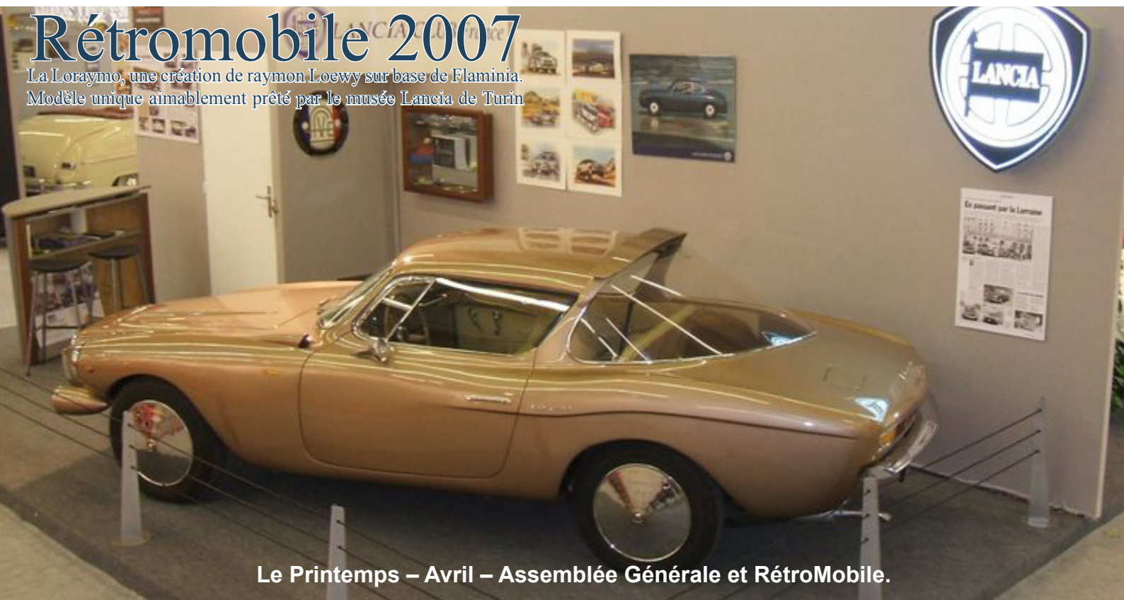
Le Printemps – Avril – Assemblée Générale et RétroMobile.

Modèle unique aimablement prêté par le musée Lancia de Turin