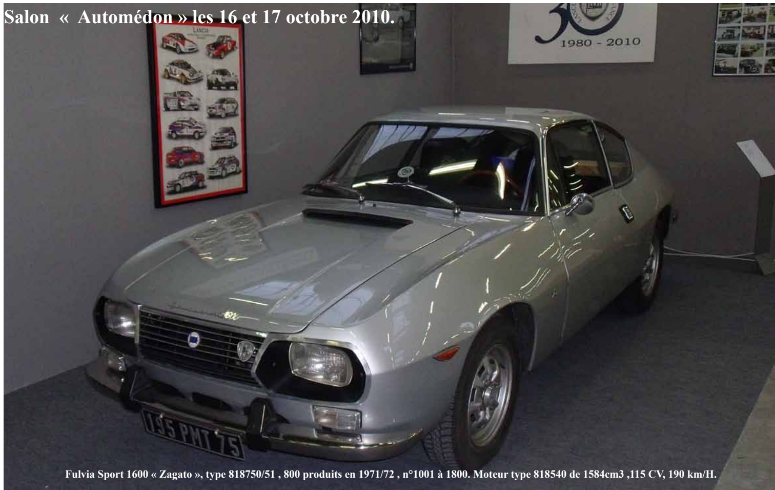
Fulvia Sport 1600 « Zagato », type 818750/51 , 800 produits en 1971/72 , n°1001 à 1800. Moteur type 818540 de 1584cm 3 ,115 CV, 190 km/H.

Salon « Automédon » les 16 et 17 octobre 2010.