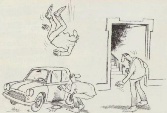
Dépêchez-vous ! je crois que quelqu'un descend