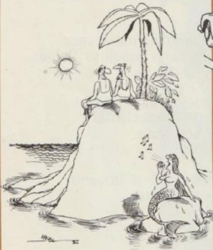
L'idée qu'il s'agisse de la police, d'une ambulance, ou des pompiers me semble pour le moins absurde.