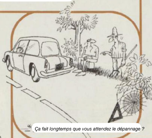
Ça fait longtemps que vous attendez le dépannage ?