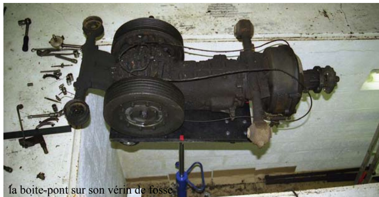
la boîte-pont sur son vérin de fosse

Le démontage de la coque se poursuit, avec de très nombreuses photos prises, en particulier pour tout ce qui est garnissage intérieur, joints, sellerie et autres joyeusetés pas toujours évidentes à positionner correctement au remontage. Restent quelques éléments mécaniques à déposer : boîte-pont, trains avant/arrière, réservoir de carburant, tubulures de freinage et de carburant, circuit électrique complet. Long travail pour ce dernier, puisqu'il faut repérer chaque fil, chaque branchement pour faciliter le remontage.