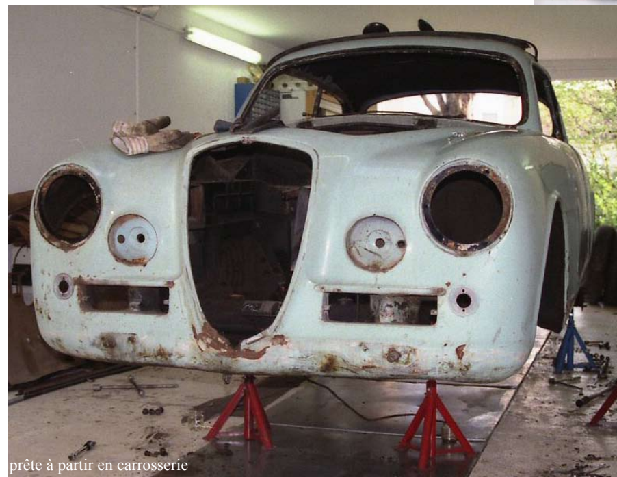
prête à partir en carrosserie