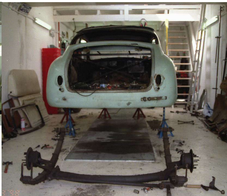
dépose du train arrière complet