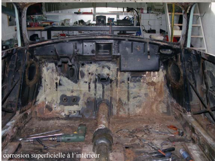
corrosion superficielle à l'intérieur