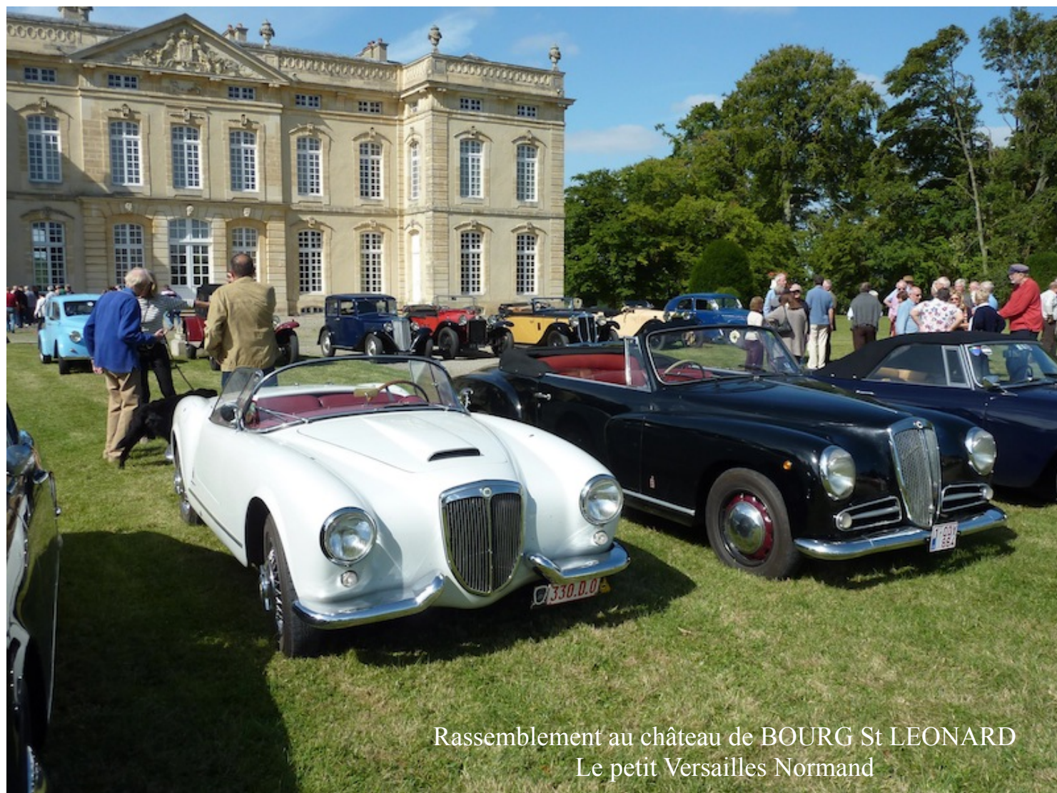
Rassemblement au château de BOURG St LEONARD Le petit Versailles Normand