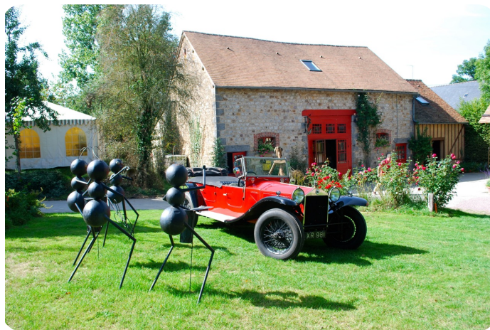
Etape du Samedi Midi Une Lambda s'est échappée!

La pelouse du château de Carrouges, (visite recommandée) qui nous accueillait pour le dernier déjeuner offrait un cadre parfait à nos adieux émus et ponctués de « à l'année prochaine dans les Alpes ».