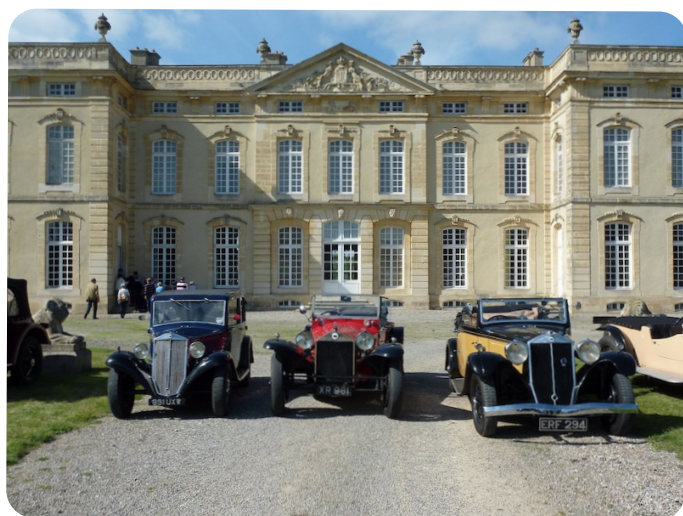
Belna Lambda Dilambda devant le petit Versailles Normand Les anciennes sont de la fête

Lancia sous le soleil de septembre devant le petit Versailles normand de Bourg Saint Léonard.