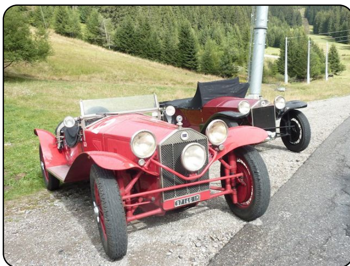
Nombres LWR par série et chiffre de production par série